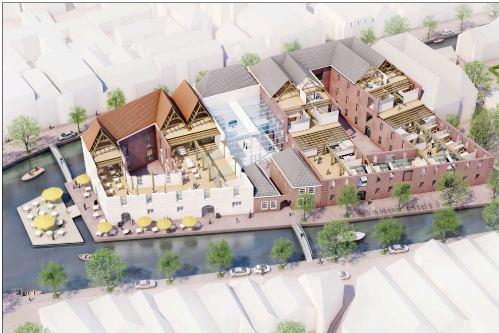
Impressie van het Arsenal na de herontwikkeling

De gemeente vindt dat het schiereiland goed bereikbaar moet worden en daarvoor zouden twee bruggen nodig zijn. De Raad van State heeft op 3 juli 2019 een uitspraak in deze zaak gedaan en komt tot het oordeel dat Delft terecht de ontsluiting van Het Arsenal het zwaarst heeft laten wegen. De Raad van State vindt wel dat Delfia Batavorum er terecht over klaagt dat de gemeenteraad een kritisch advies over de brug van de Rijksdienst Cultureel Erfgoed niet aan het bestemmingsplan heeft toegevoegd. Dat had wel gemoeten. Om formele redenen verklaarde de Raad van State het beroep van onze vereniging daarom gegrond. De volledige tekst van de uitspraak is te lezen op de website van de Raad van State onder https://www.raadvanstate.nl/@116140/201801625-1-r3/