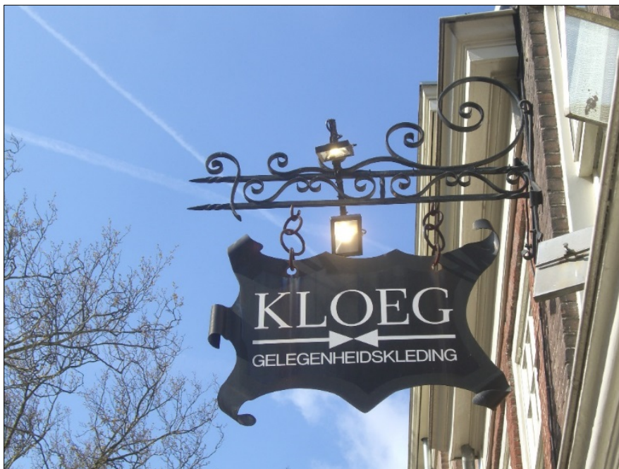
Kloeg gelegenhedskleding in de Broerhuisstraat